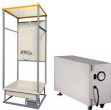
温水シャワーの排水処理に

高分子吸水ポリマーは自重の数百倍の水分を吸収固化(ゲル化)しますので固体としてアスベスト廃棄用袋で処理できます。(水質により吸水倍率は変わります。)