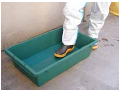
靴底等の洗浄液の廃棄に、