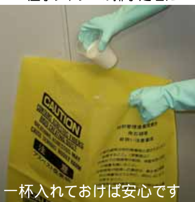
一杯入れておけば安心です