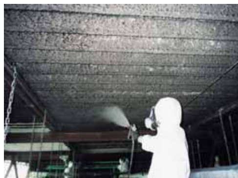
床にこぼれた飛散防止剤に、