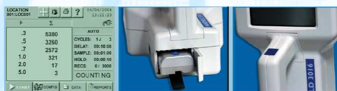
温度表示部 充電バッテリー スタート/ストップスイッチ